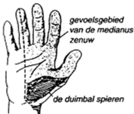
fig. 1 Overzicht van de functie van de medianus zenuw

Carpal tunnel syndroom is een afwijking die wordt veroorzaakt door een ingeklemde zenuw in de pols. In de pols is een ruimte aanwezig die carpal tunnel wordt genoemd. In deze tunnel bevinden zich de medianuszenuw (zie figuur 1) en buigpezen die doorlopen vanuit de onderarm naar de hand (zie figuur 2). Een carpal tunnel syndroom ontstaat doordat een vernauwing en/of zwelling in deze tunnel toeneemt. Wanneer de druk groot genoeg wordt, ontstaat er een belemmering in de functie van de zenuwvezels en in ernstige gevallen zelfs een beschadigde zenuw. Dit veroorzaakt doofheid, prikkelingen, pijn in de arm, hand en vingers.