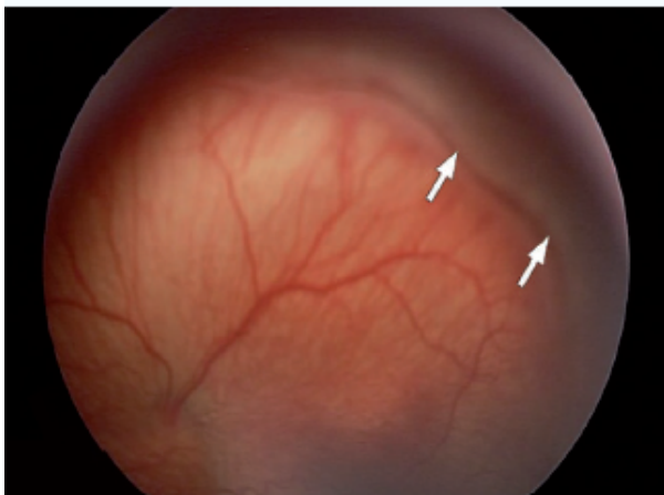
Foto van ROP.

De pijltjes wijzen naar de plaats waar de uitgroei van bloedvaten gestopt is.