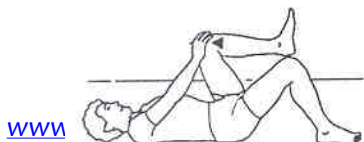
Fig. 1 Uitvoering: trek met uw handen afwisselend de

Uitgangshouding: het bed volledig plat en in rugligging met opgetrokken knieën.