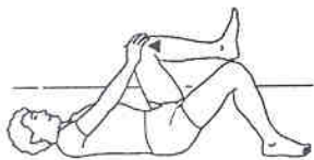
Fig. 1 Uitvoering: trek met uw handen afwisselend de linker en rechter knie naar de borst. Houd de knie steeds 5 seconden vast. Geen verende beweging!

Uitgangshouding: het bed volledig plat en in rugligging met opgetrokken knieën.